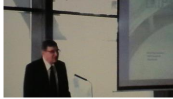
dr. Scheuer Gyula kancellár, ELTE

A címhez kapcsolódó előadások sorozatát dr. Scheuer Gyula , az Eötvös Lóránt Tudományegyetem kancellárja nyitotta meg. Tájékoztatta a hallgatóságot, hogy az EIIR bevezetését az államtitkárság preferálja, ugyanis a projekt a standardizálás irányába történő elindulás. Kancellár úr hangsúlyozta, hogy a projekt egyik nagy előnye, hogy nem terheli az saját informatikai rendszert.